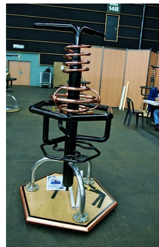
Réalisation Laurent BOYE - meilleur ouvrier de France 2011

C.O.E.T. Aveyron - 52 avenue du Maréchal Joffre - 12000 RODEZ Mobile : 06 71 62 26 99 - Email : commissaire-coet12@meilleursouvriersdefrance.org